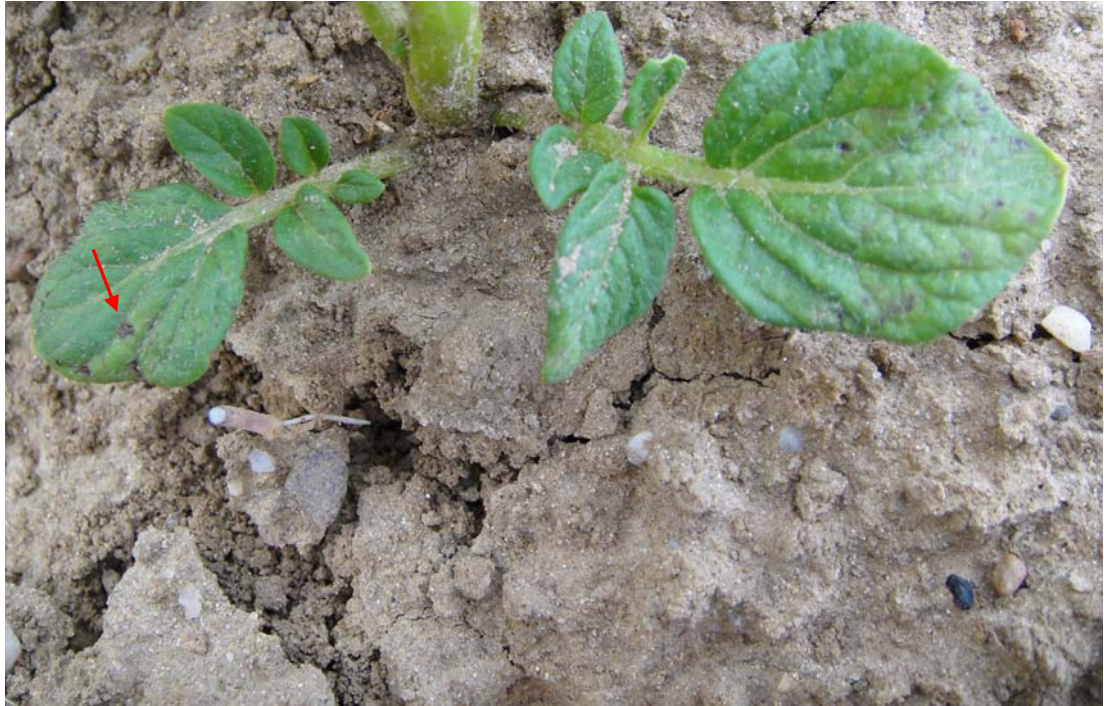
图 2 干燥条件下“中心病株”近地面叶片晚疫病病斑