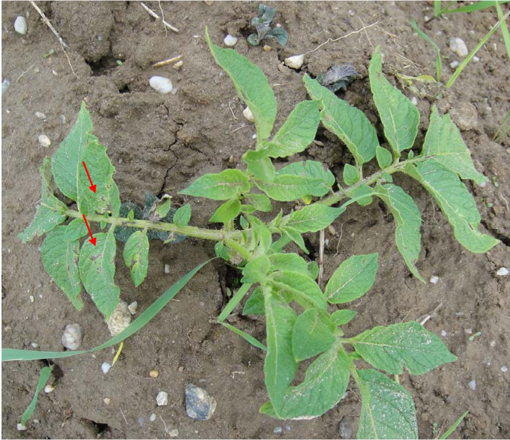
图 2 近地面叶片最早出现晚疫病病斑形成“中心病株”