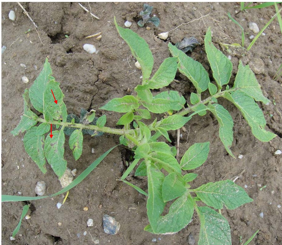
图2 近地面叶片最早出现晚疫病病斑形成“中心病株”

注：此表根据中央气象台的天气预报，针对的区域为一个县，局部地块由于小气候差异可能与本预测趋势不符，需特殊对待，有问题请与我们联系。